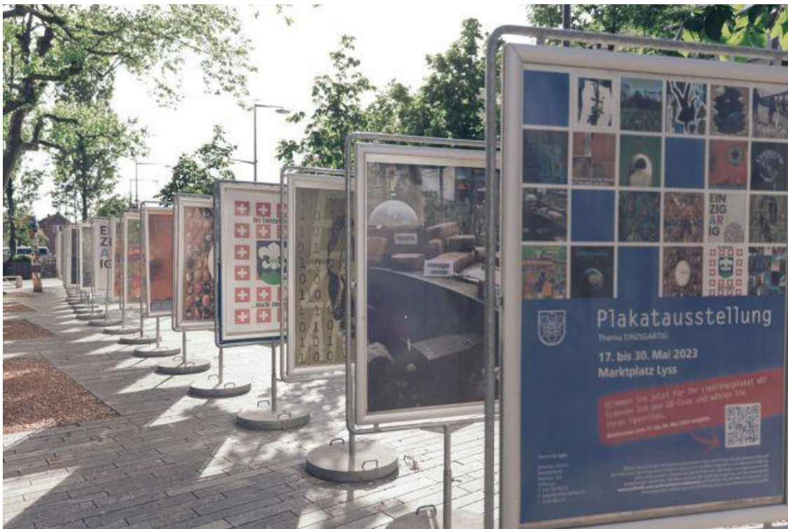
Ausstellung 2023, Marktplatz

Plakat-Ausstellung: Marktplatz Lyss, 8. bis 21. Mai 2024 Chömet verbi!